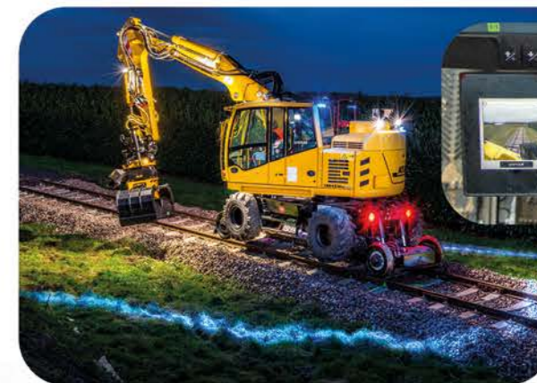
Caméra pour détection piétons

Pour une sécurité renforcée sur les chantiers, une lumière LED bleue projetée au sol matérialise la zone d'évolution de l'engin, en complément du système de détection piétons.